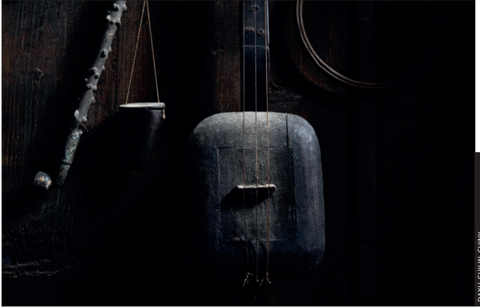
DAXU, GUILIN, CHINY

Światło jest tak ważne, że czasami wystarczy jego odrobina, by wyczarować ciekawą scenę i nadać czemuś zwykłemu tajemniczy albo egzotyczny wygląd, tak jak stało się w przypadku tego zdjęcia, przedstawiającego instrument muzyczny i narzędzia wiszące na ścianie w wiejskim domu w Chinach. Moją uwagę przykuło właśnie miękkie światło — przez szczelinę w blaszanym dachu nad tymi przedmiotami wpadało go bardzo niewiele, ale to właśnie jemu zawdzięczam dramaturgię i nastrój tego ujęcia. Spacerując po mieście, warto zwracać uwagę na takie szczypty urzekającego światła, bo często nie wymagają one interesującego tematu. Tematem staje się samo światło.