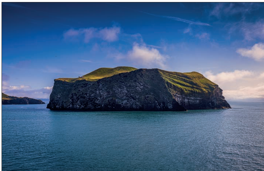
HEIMAEY, VESTMANNAEYJAR, ISLANDIA

Jednym z najczęstszych błędów, jakie widuję na fotografiach podróżniczych i krajoobrazowych, jest przekrzywiona linia horyzontu. Zarazem jest to najprostszy do usunięcia błąd. Przekrzywiony horyzont jest zły po prostu dlatego, że bardzo przeszkadza w odbiorze zdjęcia. Może widziałeś u kogoś na ścianie w domu lub w biurze oprawione zdjęcie, które wisi trochę krzywo? Na takiej fotografii nie sposób się skupić — aż korci, by przyskoczyć i ją wyprostować. Przekrzywiony horyzont jest cyfrowym odpowiednikiem takiej sytuacji i psuje mnóstwo zdjęć. W ferworze fotografowania czasami trudno jest zrobić idealnie proste zdjęcie — zwłaszcza jeśli pstryka się z ręki — ale ponieważ Lightroom i Photoshop potrafią wyprostować kadr jednym kliknięciem, pochyły horyzont nie ma dziś racji bytu. Dobre zdjęcia z podróży nie są przekrzywione, skoryguj więc linię horyzontu. (Zanim podejdziesz i sam wyprostujesz to zdjęcie wiszące za Twoim biurkiem. Jasne, pewnie poczekam, aż na chwilę wyjdiesz, ale gdy tylko znikniesz mi z oczu, podbiegnę, by ustawić je prosto!).