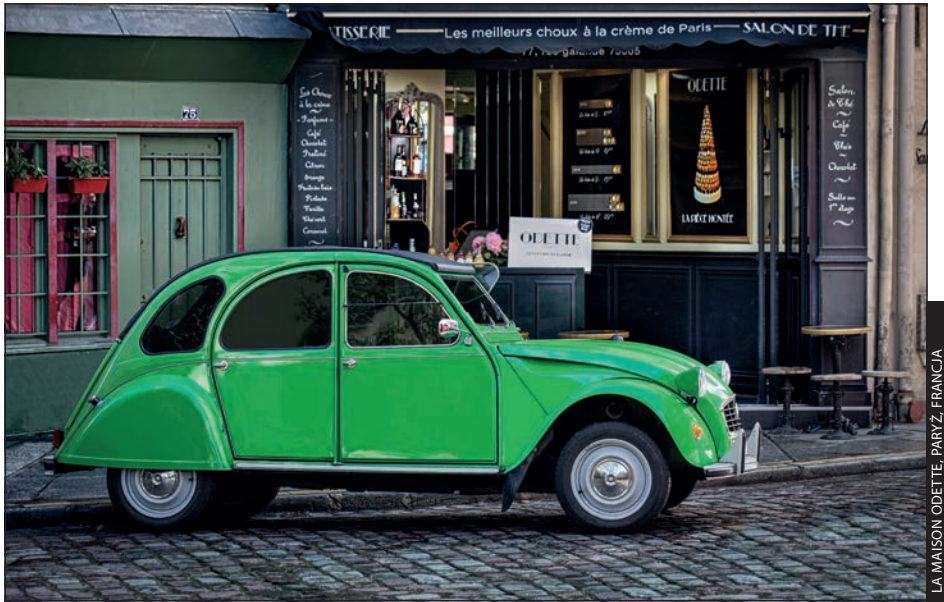
LA MAISON ODETTE, PARYŻ, FRANCJA

Pamiętam, jak pewnego dnia spacerowałem z żoną po nabrzeżu portowym, do którego zamówiono mnóstwo małych łodzi, ale zamiast robić im zdjęcia po prostu siedłem przed siebie, mijając ich dziesiątki. Wreszcie moja żona przystanęła, wskazała pobliską łódź i zapytała: „Co z nią nie tak? Wygląda uroczo”. Zgodziłem się — była urocza — ale miałem też inne zdanie. „Widzisz ten wielki silnik Mercury Marine uciepiony do rufy? Zabija cały urok i romantyczność tej sceny. Szukam zwykłej, prostej łodzi wiosłowej. Tylko wiosła. Żadnego wielkiego motoru. Żadnych plastikowych butelek walających się po dnie. Żadnego radia, foliowych toreb. Nic, co pozwoliłoby określić czas zrobienia zdjęcia”. Zrozumiała mnie bez dalszych wyjaśnień i wraz ze mną zaczęła szukać takiej urzekającej łodzi. Oczywiście możesz robić świetne, nowoczesne zdjęcia, ale to jak naklejenie na fotkę informacji o dacie wykonania. Jeśli uda Ci się skomponować kadr tak, by nie było w nim widać świadczących o współczesności napisów albo samochodów w tle, zyskasz okazję do pokazania widzowi obrazu ponadczasowego — pełnego uroku, romantyzmu i okazji do własnych interpretacji. Poza tym szukanie takich scen jest po prostu przyjemne. Może nie zawsze łatwe, ale jeśli uda Ci się skomponować ów idealny ponadczasowy kadr, przekonasz się, że było warto.