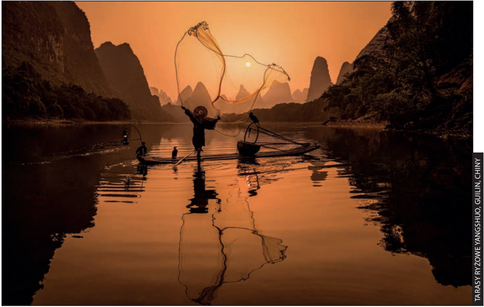
TARASY RYZOWE YANGSHUO, GUILIN, CHINY

Czy głównym tematem znakomitego zdjęcia z podróży może być kolor? Jasne. A piękne światło o poranku? Bez wątpienia. Pierwiastek ludzki? Oczywiście. W tym rozdziale napisałem o wielu czynnikach, które umożliwiają zrobienie znakomitej fotografii z podróży, lecz jeśli chcesz podnieść sobie poprzeczkę, pomyśl o połączeniu kilku z nich w jednym zdjęciu. Może to być miejsce sfotografowane w pięknym świetle cechujące się ciekawą kolorystyką oraz obecnością tubylców. Dzięki temu przywieziesz z podróży jeszcze lepsze kadry. Łącząc poznane elementy umożliwiające robienie fantastycznych zdjęć podróżniczych, stworzysz wielowarstwowe obrazy, w których widzowie po prostu się zakochają. Przyjrzyj się choćby przykładowej fotografii powyżej. W tym jednym kadrze dzieje się bardzo wiele: jest świetna, wyrazista kolorystyka; zdjęcie zostało zrobione niedługo po wschodzie słońca, więc cienie są wciąż dość miękkie; widać efekty atmosferyczne (mgiełka na niebie); jest element ludzki — tutejszy rybak zarzuca sieć (akcja!) w ciekawej scenerii. Do tego dochodzi skuteczna obróbka w cyfrowej ciemni (skorygowałem balans bieli tak, by ocieplić kolorystykę sceny, zwiększyłem kontrast i usunąłem odwracające uwagę detale). Dzięki połączeniu takich cech zdjęcie staje się głębsze, wielowymiarowe i skłania widza do uważniejszego spojrzenia.