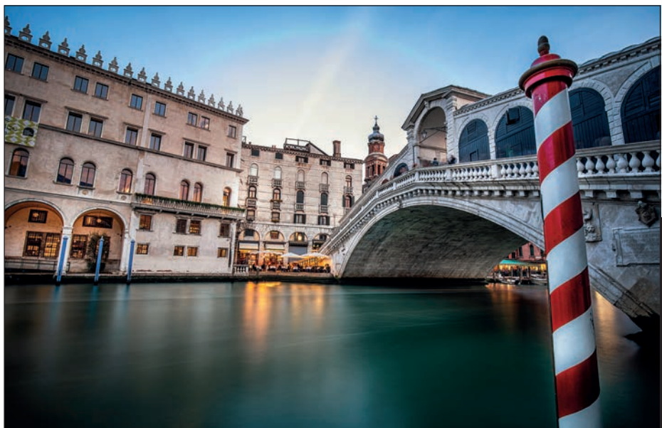
MOST RIALTO, WENECJA, WŁOCHY

Dobre zdjęcia z podróży nie są rozmyte. Nie są trochę nieostre. Jeśli patrząc na zdjęcie zadajesz sobie pytanie: „Czy ono jest ostre?“, znaczy to, że nie jest. Świetne fotografie podróżnicze mogą być naturalnie miękkie — takie jak zrobiona o poranku fotka wśród unoszących się mgieł — ale nie mogą być nieostre. Przejrzyj na Instagramie zdjęcia dowolnych świetnych fotografów-podróżników. Czy przy którymkolwiek pomyślisz sobie: „Hmm, to zdjęcie wygląda na trochę nieostre...”? Nie. Ci spece dbają o perfekcyjne ustawianie ostrości, ponieważ (powiedz to razem ze mną): „Znakomite zdjęcia z podróży są ostre”. Gdy światła jest mało i czas naświetlania się wydłuża (co nie stanowi problemu podczas fotografowania w plenerze w słoneczny dzień), może Ci się przydać lekki statyw albo platy pod. Kiedy zobaczysz, jak ostre i wyraziste są zrobione przy ich użyciu zdjęcia, przekonasz się, że warto było zabrać dodatkowe akcesorium. Jeśli zrobisz zadowolająco wyraziste zdjęcie, możesz przy użyciu Photoshopa czy Lightrooma przemienić je w ostre jak żyletka — dostępne w tych programach narzędzia do wyostrażania są znakomite (więcej na ten temat możesz przeczytać w rozdziale 12.). Ale jeżeli zrobisz rozmyte zdjęcie, te programy jedynie złagodzą rozmycie — nie wyczarują z niego ostrego obrazu. O to musisz zadbać już w aparacie.